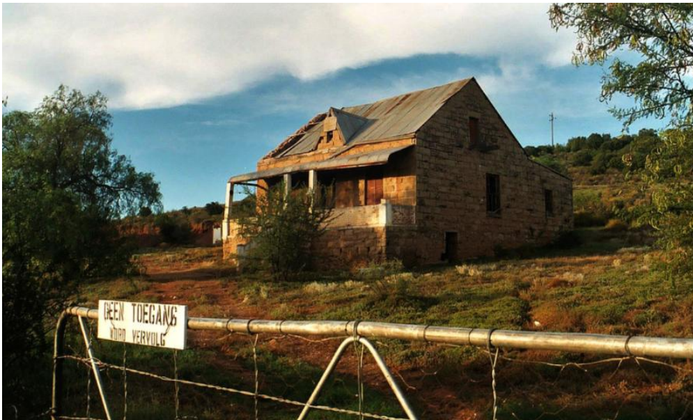
Een van de vele vervallen Zuid-Afrikaanse boerderijen

Volgens Ramaphosa zal Zuid-Afrika als de 'Hof van Eden' zijn als de zwarten het land in handen hebben. En hun geduld zou op zijn. Toch heeft het eerdergenoemde SAIRV na onderzoek bevonden dat slechts tussen 1 en 2 procent van de mensen prioriteit geeft aan landherverdeling, terwijl 47 procent prioriteit geeft aan werkloosheidsbestrijding. Men wil onderwijs en werkgelegenheid, en maar weinig zwarten willen boeren. 82 procent van het reeds teruggegeven land is dan ook stedelijke grond, en gevraagd of men liever met land of geld gecompenseerd wil worden, koos 93 procent voor geld. Inmiddels is 90 procent van de 'herverdeelde' boerengrond verloederd, onrendabel geraakt en verlaten. De weinige zwarten die boer geworden zijn, blijken meestal onbekwaam of armlastig, of zij voelen zich niet gesteund door de regering wegens gebrek aan scholing en subsidies. Zij raken failliet of haken af.