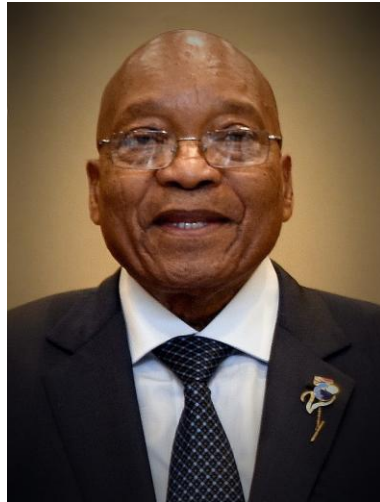
President Jacob Zuma

Onder Zuma stonden overheidsbedrijven als Transnet, SAL (Suid-Afrikaanse Lugdiens) en Eskom op instorten wegens geldgebrek. Eskom raakte iedereen. Woon- en sloppenwijken breidden zich snel uit waardoor het achterstallig onderhouden elektriciteitsnetwerk overbelast raakte. En om het te ontlasten legde de regering overal gefaseerd de stroomvoorziening plat, wat bij de bevolking veel stress veroorzaakte en het bedrijfsleven grote verliezen opleverde. Er werd bij Eskom zo veel gegraaid en zo veel uitbesteed aan de vele dure black-owned familiebedrijfjes van werknemers, dat er geen geld was voor blijvende oplossingen: sinds 1994 werd er slechts één elektriciteitscentrale bijgebouwd (in 2015). Zo verging het ook andere overheidsbedrijven.