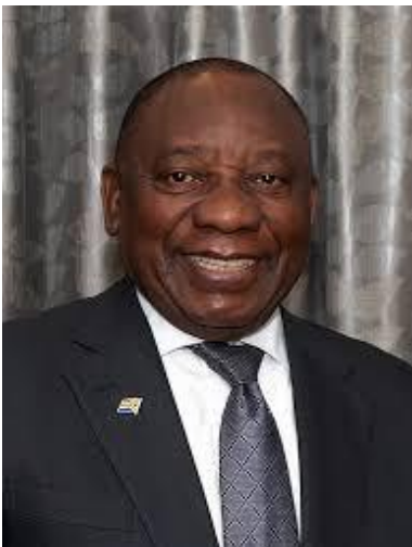
President Cyril Ramaphosa

Maar iedereen wist dat dit onhaalbaar was. Al tijdens Zuma was duidelijk dat de groei minder dan 1 procent zou blijven; Ramaphosa's termijn kende, en kent, negatieve groei en ging al voor de coronacrisis door een recessie, die nu uitgemond is in de gevreesde junkstatus.