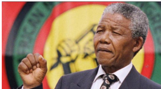
President Nelson Mandela

Blanken die zwarte overheersing vreesden, beloofde Mandela diversiteit en zwarten die snellere verandering wilden maande hij tot geduld. Hij hoopte hiermee ook binnenlandse en buitenlandse investeerders gerust te stellen. Het ontbrak de regering namelijk aan geld om de welvaartsverdeling te laten slagen: ze had verwacht dat de wereld het pasbevrijde land