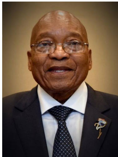
President Jacob Zuma

Onder Zuma stonden overheidsbedrijven als Transnet, SAL (Suid-Afrikaanse Lugdiens) en Eskom op instorten wegens geldgebrek. Eskom raakte iedereen. Woon- en sloppenwijken breidden zich snel uit waardoor het achterstallig onderhouden elektriciteitsnetwerk overbelast raakte. En om het te ontlasten legde de regering overal gefaseerd de stroomvoorziening plat, wat bij de bevolking veel stress veroorzaakte en het bedrijfsleven grote verliezen opleverde. Er werd bij Eskom zo veel gegraaid en zo veel uitbesteed aan de vele dure black-owned familiebedrijfjes van werknemers, dat er geen geld was voor blijvende oplossingen: sinds 1994 werd er slechts één elektriciteitscentrale bijgebouwd (in 2015). Zo verging het ook andere overheidsbedrijven.