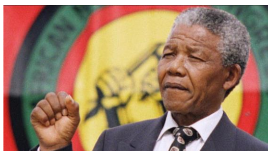
President Nelson Mandela

Blanken die zwarte overheersing vreesden, beloofde Mandela diversiteit en zwarten die snellere verandering wilden maande hij tot geduld. Hij hoopte hiermee ook binnenlandse en buitenlandse investeerders gerust te stellen. Het ontbrak de regering namelijk aan geld om de welvaartsverdeling te laten slagen: ze had verwacht dat de wereld het pasbevrijde land royaal zou bijspringen, maar investeerders hielden de hand op de knip uit angst voor te radicale herverdelingsprogramma's. Die angst groeide toen bleek dat de linkervleugel van het ANC en zijn extreemlinkse alliantiepartners (de Zuid-Afrikaanse Communistische Partij en de vakbond COSATU) dieper in de economie wilden ingrijpen en haast wilden maken met de herverdeling.