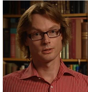
Door: Marcel Bas

Met de definitieve afwaardering in maart (2020) van Zuid-Afrika naar junkstatus door kredietbeoordelaar Moody's, is de kroon gezet op twee decennia ANC-beleid. De partij van Nelson Mandela zou voor een nieuw tijdperk van de mensheid staan. In 1994 bevrijdde ze het land van de blanke racisten en het Nieuwe Zuid-Afrika zou in de jaren daarop de irrelevantie van ras bewijzen. Vol optimisme zag men de geboorte van een multicultureel, liberaal gidsland aan: het bevrijde Zuid-Afrika draaide op een liberale grondwet, staatsbestel en vrije markt, en iedereen was gelijk. Echter, al na drie jaar machtsoverdracht begonnen de bevrijders rampzalige trekken te vertonen. De internationale gemeenschap keek echter weg en het ANC slaagde erin binnen 20 jaar een welvarend land te gronde te richten. Hoe kon dit zo gebeuren?