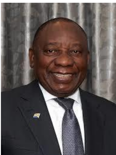
President Cyril Ramaphosa

Maar iedereen wist dat dit onhaalbaar was. Al tijdens Zuma was duidelijk dat de groei minder dan 1 procent zou blijven; Ramaphosa's termijn kende, en kent, negatieve groei en ging al voor de coronacrisis door een recessie, die nu uitgemond is in de gevreesde junkstatus.