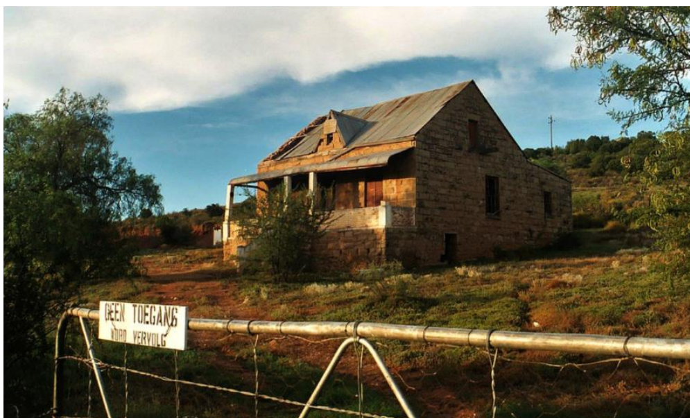
Een van de vele vervallen Zuid-Afrikaanse boerderijen

Volgens Ramaphosa zal Zuid-Afrika als de 'Hof van Eden' zijn als de zwarten het land in handen hebben. En hun geduld zou op zijn. Toch heeft het eerdergenoemde SAIRV na onderzoek bevonden dat slechts tussen 1 en 2 procent van de mensen prioriteit geeft aan landherverdeling, terwijl 47 procent prioriteit geeft aan werkloosheidsbestrijding. Men wil onderwijs en werkgelegenheid, en maar weinig zwarten willen boeren. 82 procent van het reeds teruggegeven land is dan ook stedelijke grond, en gevraagd of men liever met land of geld gecompenseerd wil worden, koos 93 procent voor geld. Inmiddels is 90 procent van de 'herverdeelde' boerengrond verloederd, onrendabel geraakt en verlaten. De weinige zwarten die boer geworden zijn, blijken meestal onbekwaam of armlastig, of zij voelen zich niet gesteund door de regering wegens gebrek aan scholing en subsidies. Zij raken failliet of haken af.