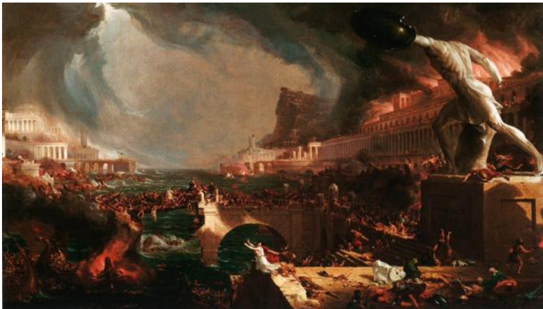
'Vernietiging van het Rijk'; deel van het vijfluk The Course of Empire van Thomas Cole.

Europeanen opgevoed zijn, proberen islamieten binnen West-Europa macht te verwerven door zich op ethnocentrische, collectivistische, religieuze en op uitsluiting gebaseerde wijzen te organiseren. Europeanen behoren zich echter niet-etnisch, individualistisch, seculier en inclusivistisch te gedragen. Het liberalisme zou met de islam het wel eens kunnen aansturen op de ineenstorting van de Westerse beschaving. Indien inheemse West-Europeanen echter nog voornemens zijn om hun samenleving en cultuur te behouden, dan zijn zij gedwongen zichzelf ook als een collectief – dus meer ethnocentrisch en dus onliberaal – op te stellen, zodat zij hun cultuur terecht kunnen uitdragen als de leidende cultuur van voorkeur.