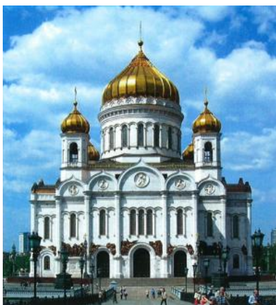
De Oosters-orthodoxe Christus Verlosserkathedraal in Moskou

Vanaf het midden van de twintigste eeuw tot 1989 waren de oostelijke EU-lidstaten aangesloten bij het intimiderende Warschaupact – dit door Rusland overheerste machtsblok was de geopolitieke verwerkelijking van de enig overgebleven rivaal van het liberalisme: het communisme. In 1989 werd het pact ontbonden en wilden de meeste Oost-Europese landen deel uitmaken van de veelal op Angelsaksische leest geschoeide Westerse liberaal-democratische, welvarende samenlevingen. Ze werden dan ook lid van de EG/EU. Voor het herstel van hun nationale onafhankelijkheid en bescherming tegen Russische geopolitiek sloten ze zich aan bij de, eveneens Westerse, NAVO.