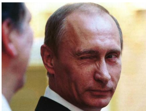
De Russische president Vladimir Poetin

Daarnaast constateert de EU-VS-coalitie dat niet alleen de Russen maar ook de andere Oost-Europese volkeren nog niet 'liberaal genoeg' denken: in wezen zijn zij ook nationalistisch en conservatief-christelijk. De Westerse leiders wensten in Oost-Europa (inclusief Rusland) een groot onontgonnen land te zien, dat ontvankelijk zou zijn voor een nieuwe, neoliberale veldtocht.